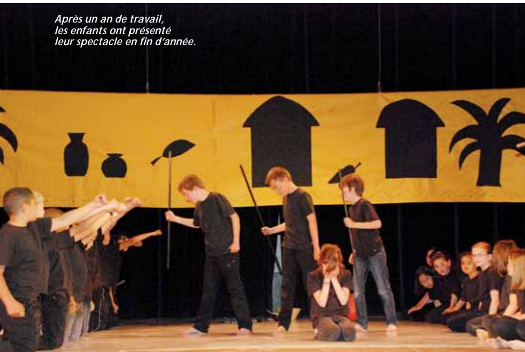
Après un an de travail, les enfants ont présenté leur spectacle en fin d'année.

Depuis plusieurs années déjà, deux professeurs de l'école municipale de musique, des dumistes, interviennent dans les écoles de la ville afin d'éveiller, et initier les plus jeunes.