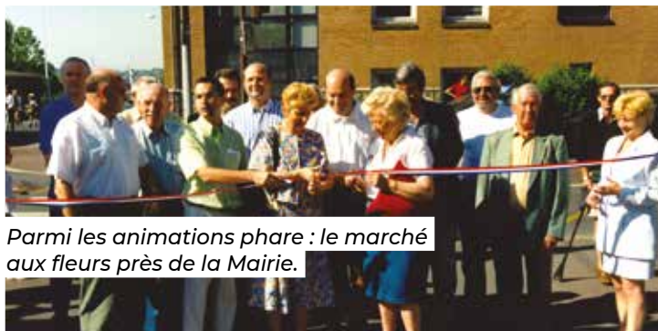
Parmi les animations phare : le marché aux fleurs près de la Mairie.