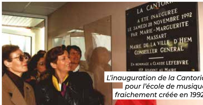
L'inauguration de la Cantoria pour l'école de musique fraîchement créée en 1992.