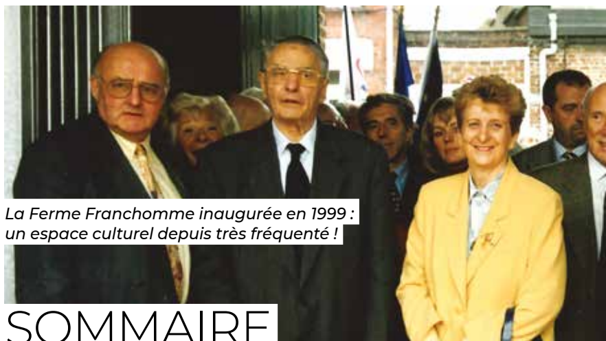
La Ferme Franchomme inaugurée en 1999 : un espace culturel depuis très fréquenté !