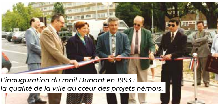
L'inauguration du mail Dunant en 1993 : la qualité de la ville au cœur des projets hémois.