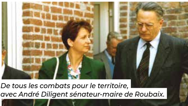
De tous les combats pour le territoire, avec André Diligent sénateur-maire de Roubaix.