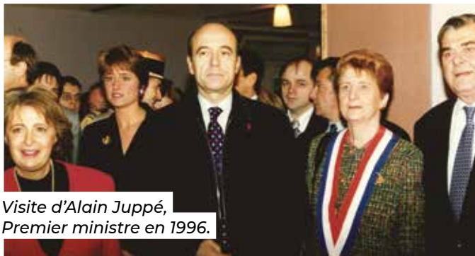
Visite d'Alain Juppé, Premier ministre en 1996.