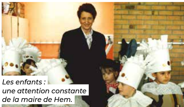
Les enfants : une attention constante de la maire de Hem.