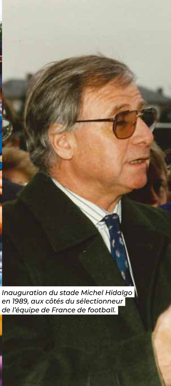
Inauguration du stade Michel Hidalgo en 1989, aux côtés du sélectionneur de l'équipe de France de football.