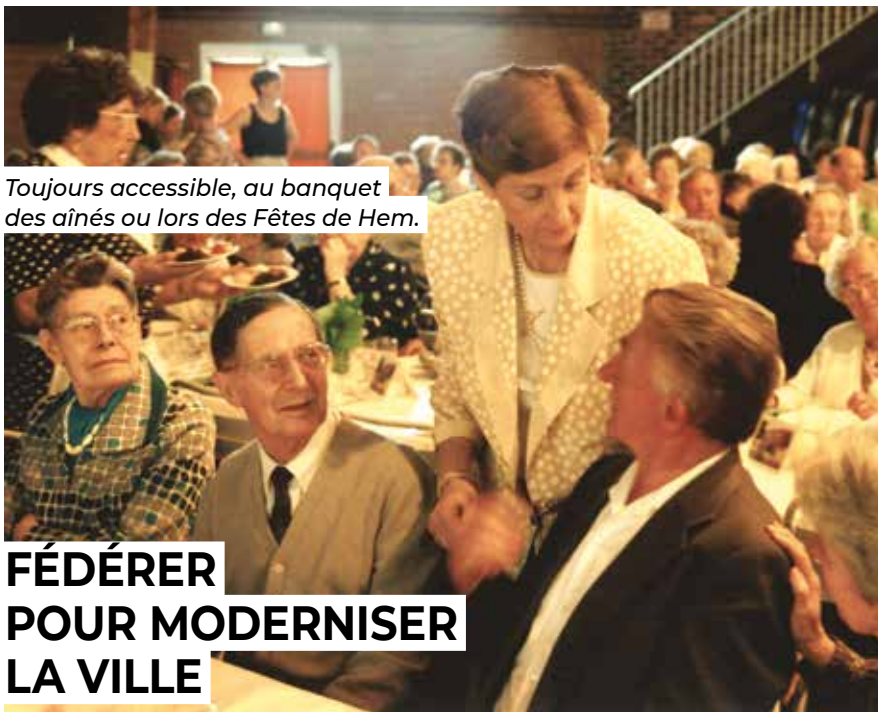
Toujours accessible, au banquet des aînés ou lors des Fêtes de Hem.