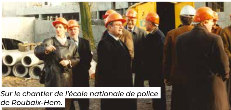
Sur le chantier de l'école nationale de police de Roubaix-Hem.