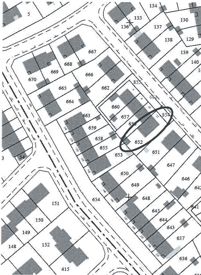
Extrait du plan cadastral - Section AZ-