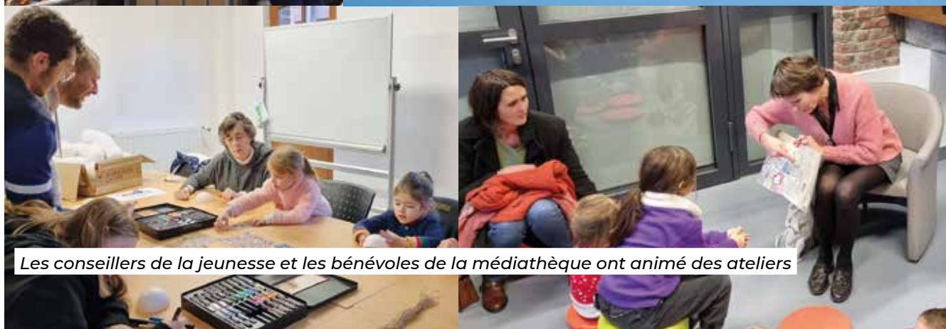
Les conseillers de la jeunesse et les bénévoles de la médiathèque ont animé des ateliers