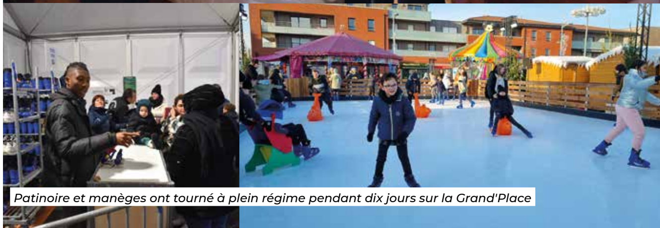
Patinoire et manèges ont tourné à plein régime pendant dix jours sur la Grand'Place