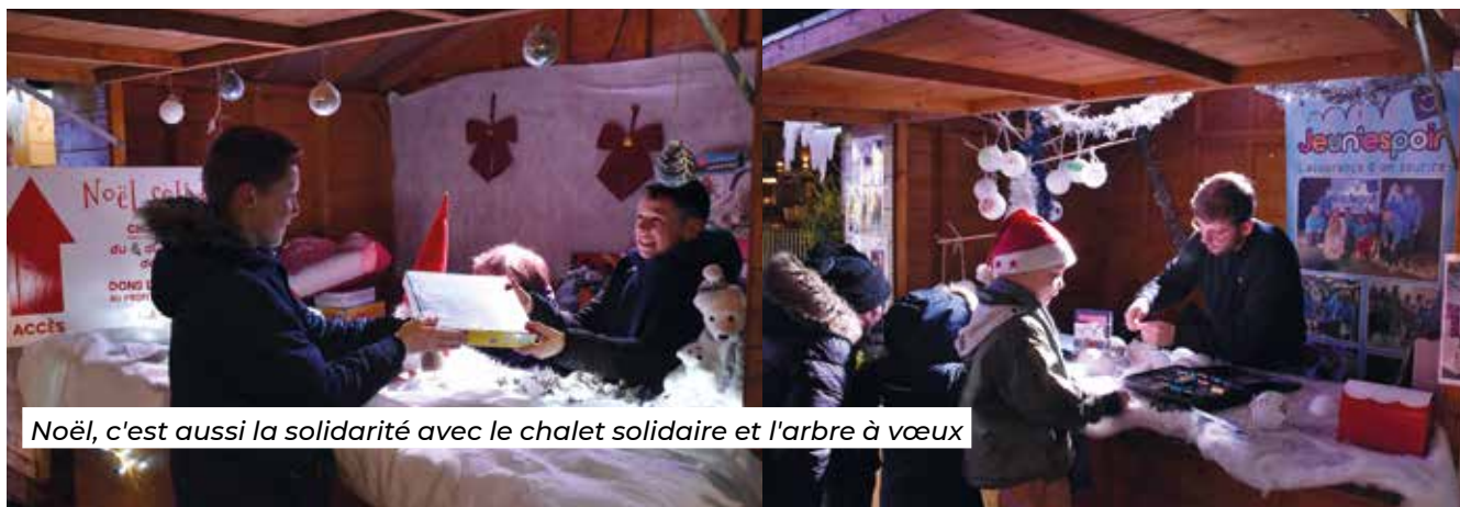
Noël, c'est aussi la solidarité avec le chalet solidaire et l'arbre à vœux