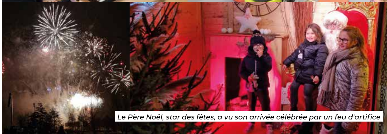
Le Père Noël, star des fêtes, a vu son arrivée célébrée par un feu d'artifice