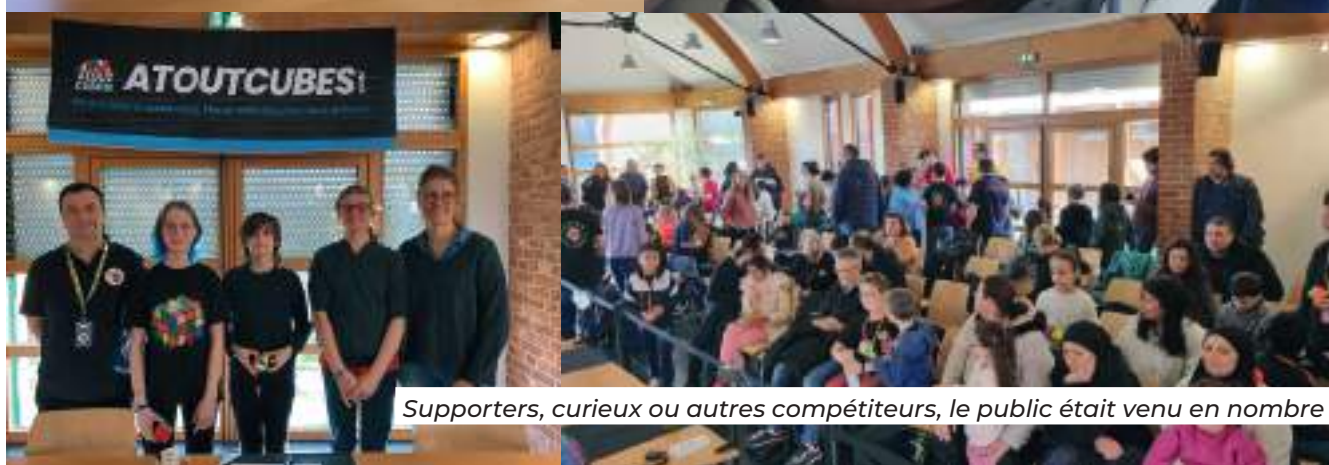
Supporters, curieux ou autres compétiteurs, le public était venu en nombre