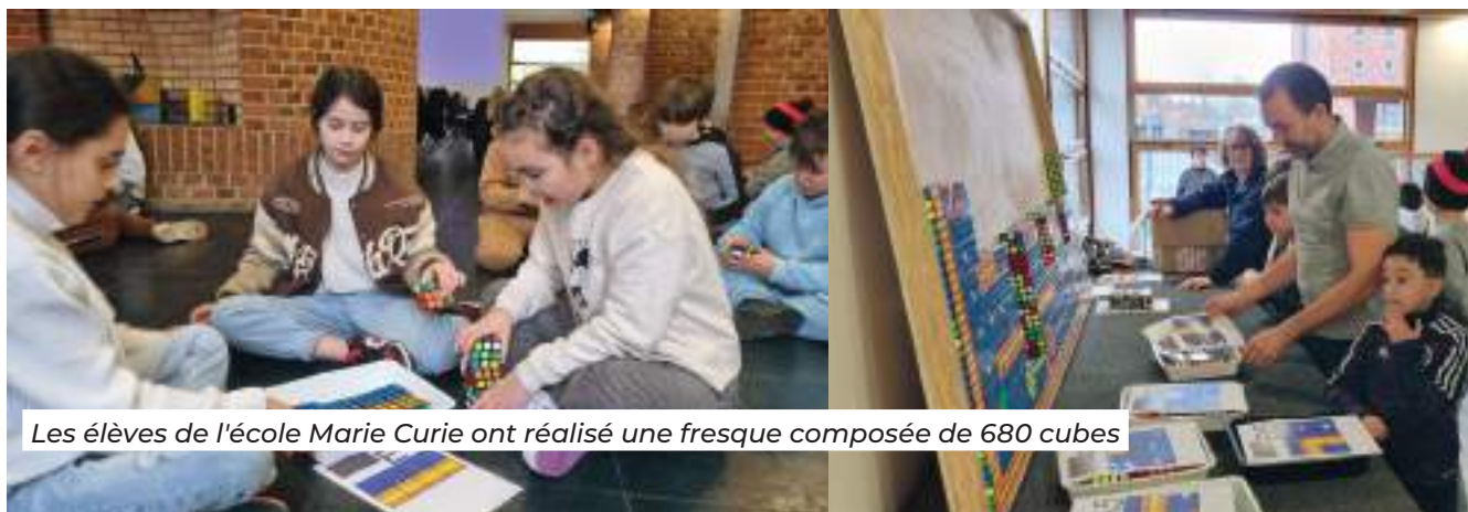
Les élèves de l'école Marie Curie ont réalisé une fresque composée de 680 cubes