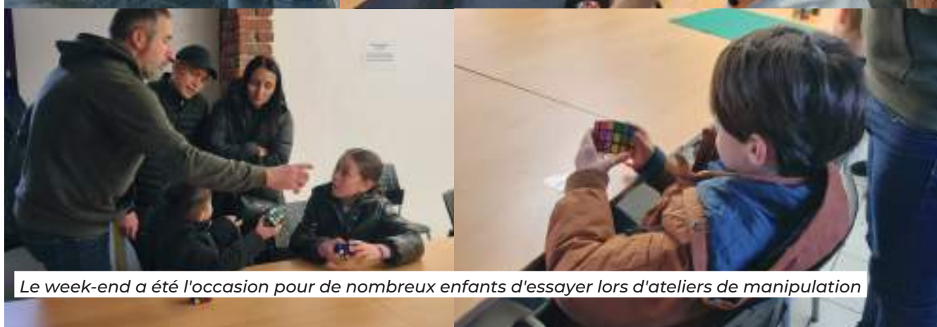
Le week-end a été l'occasion pour de nombreux enfants d'essayer lors d'ateliers de manipulation