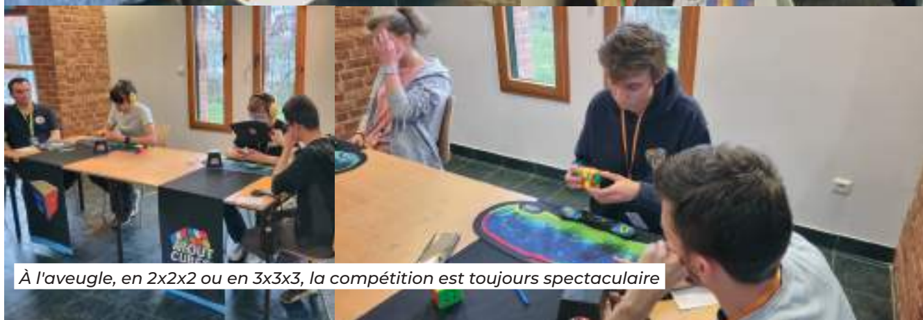
À l'aveugle, en 2x2x2 ou en 3x3x3, la compétition est toujours spectaculaire