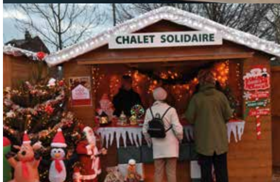
Le chalet solidaire et la lecture de contes toujours au rendez-vous !