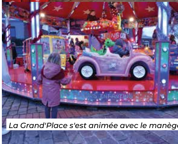
La Grand'Place s'est animée avec le manège et la patinoire