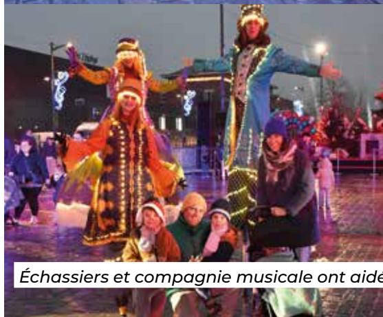
Échassiers et compagnie musicale ont aidé le public à patienter avant la venue du Père Noël