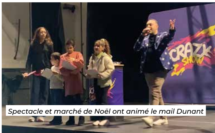
Spectacle et marché de Noël ont animé le mail Dunant