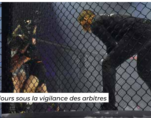
Les combats étaient engagés pendant toute la soirée, toujours sous la vigilance des arbitres