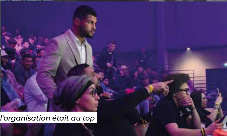
Animation, officiels, encadrement, sécurité, l'organisation était au top