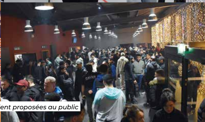
Dans le hall du Zéphyr, des animations étaient proposées au public