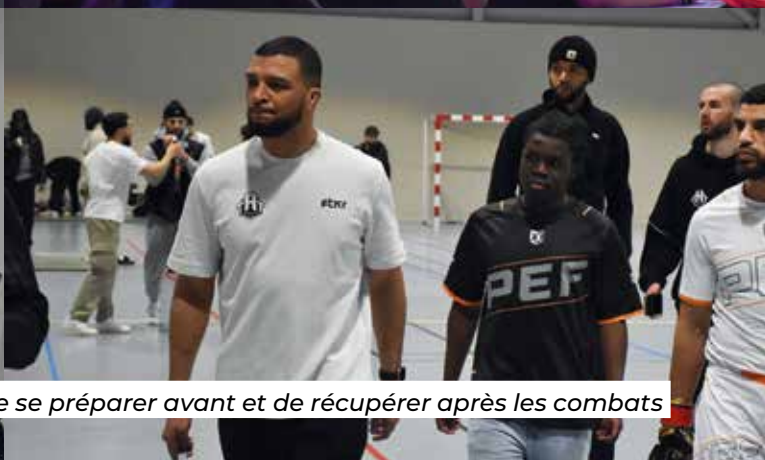
La salle Leplat a permis aux combattants de se préparer avant et de récupérer après les combats