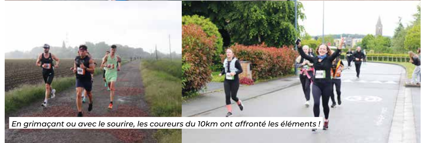
En grimaçant ou avec le sourire, les coureurs du 10km ont affronté les éléments !