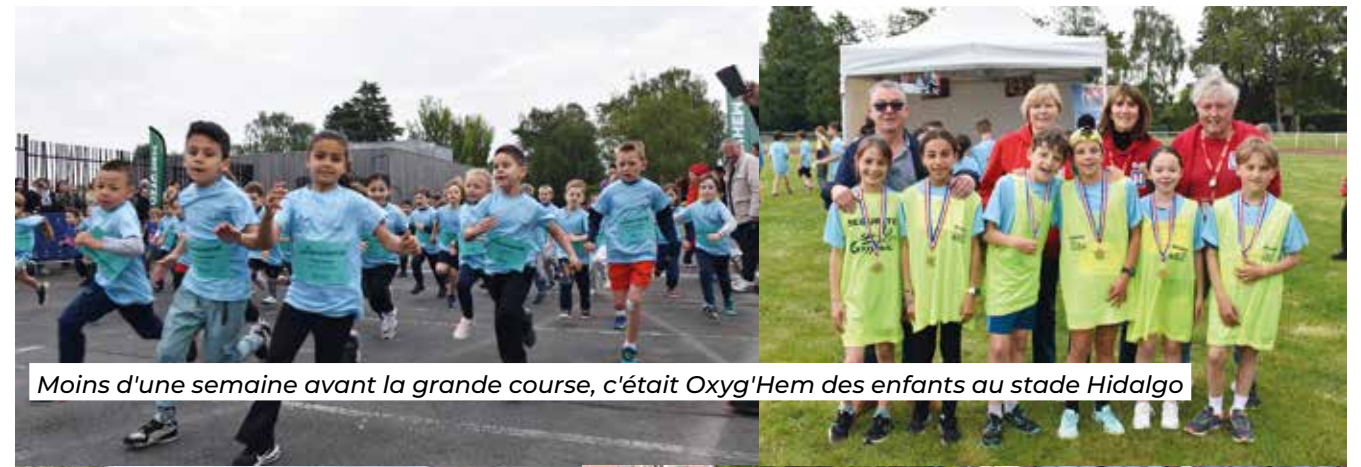
Moins d'une semaine avant la grande course, c'était Oxyg'Hem des enfants au stade Hidalgo