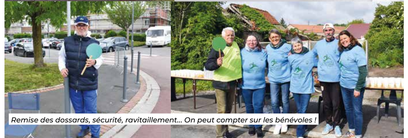
Remise des dossards, sécurité, ravitaillement... On peut compter sur les bénévoles !