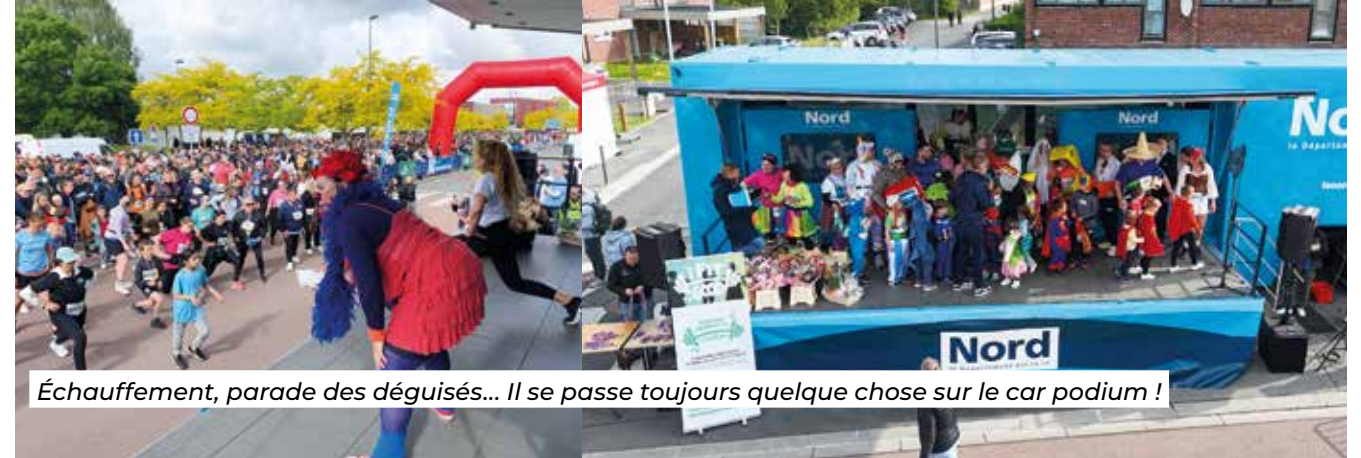
Échauffement, parade des déguisés... Il se passe toujours quelque chose sur le car podium !